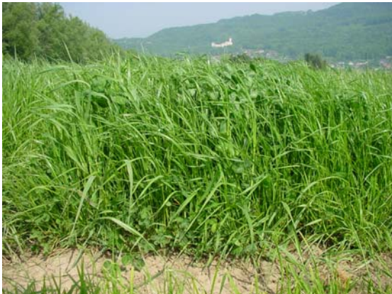
SM 330 im 2. Standjahr Mst 330 en 2 ème année